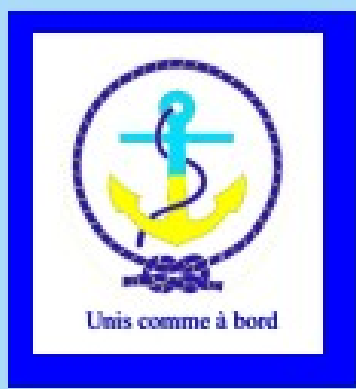
AMMAC de Castelnaudary