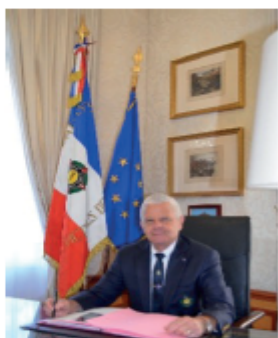
Général (2S) René PETER Président fédéral FNAM

La FNAM soutient le magazine FORCE&HONNEUR, pour et avec nos blessés : vous pourrez ainsi lire le texte ci-après, en deuxième page de ce magazine.